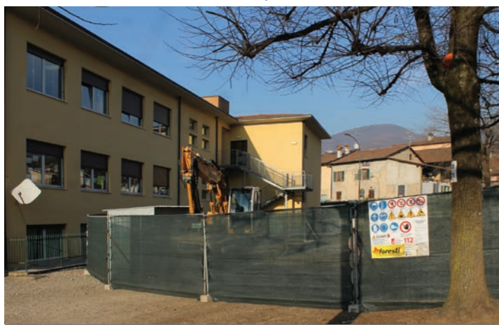
I lavori alle Scuole Elementari

A nche quest'anno, nel periodo natalizio, Monticelli brillerà un po' di più con l'installazione delle tradizionali luminarie, resa possibile grazie alla generosità di alcune aziende del paese, a cui va rivolto il nostro sentito ringraziamento. Un "addobbo" che fa il pari con la manutenzione delle aree verdi, a cui nel 2016 è stata rivolta particolare attenzione da parte dell'amministrazione.