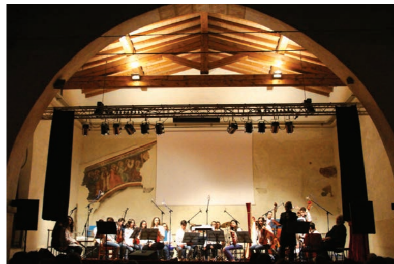
L'Orchestra delle Bollicine di Franciacorta

Essere in un gruppo è condividere qualcosa E se mi tagli fuori, è che ho sbagliato ogni cosa Ok, allora spiegami, ci incontriamo, confrontiamoci Invece di schernirmi, insultarmi e di ferirmi Guarda il "vetro", riflette il tuo viso Non riconosco il tuo sorriso Rompi il "vetro" e fatti vedere Non hai il diritto di farmi soffrire Sembra uno scherzo ma io Sto male da morire Lanciami un segnale con gli occhi Prendimi le mani lascia che mi tocchi l'anima ...Esagera E seduti all'ombra "della Rosa" Il cielo è d'albicocca, guarda la città che riposa ...fantastica. Lanciami un segnale con gli occhi Prendimi le mani lascia che mi tocchi l'anima Ora Litigare, per capire per spiegare e crescere Vola la parola nulla resta e ...ridere Strumentale..... Guarda il "vetro", riflette il tuo viso Non riconosco più il tuo sorriso Rompi il "vetro" e fatti vedere Non hai il diritto di farmi soffrire Sembra non sia importante ma io Sto male da morire Lanciami un segnale con gli occhi Prendimi le mani lascia che mi tocchi l'anima ...Esagera E seduti all'ombra "della Rosa" Il cielo è d'albicocca, guarda la città che riposa ...fantastica Lanciami un segnale con gli occhi Prendimi le mani lascia che mi tocchi l'anima Ora Parlato: Vola la parola nulla resta e ....vivere