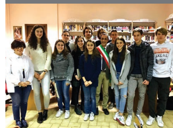
I ragazzi premiati