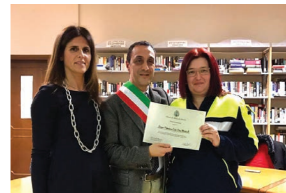
Protezione Civile Ome-Monticelli Brusati