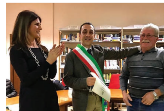
Gruppo escursionistico Monte Rosa