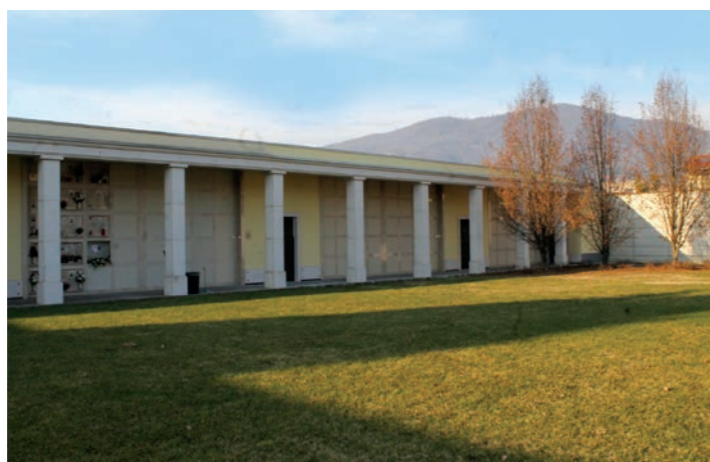
La nuova ala del cimitero