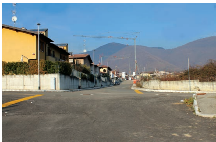
Il Comparto "4 Vie"